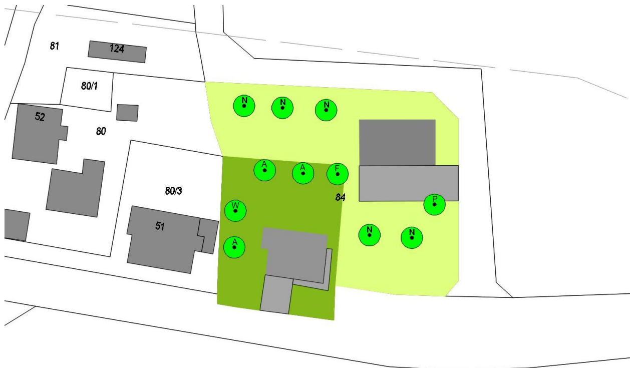
Abb. 1b: Zukünftige Bebauung (A=Apfel, F=Fichte, N=Vorschlag Neupflanzung, P=Pflaume, W=Walnuss)

Auf dem Plangebiet soll ein Wohnhaus sowie eine Lagerhalle errichtet werden. Insgesamt wird etwas mehr als ein Drittel der bisherigen Fettwiese in eine andere Nutzung in Form von Gebäude-, Stell- oder Gartenfläche umgewandelt. Das Erscheinungsbild der Fläche wird somit grundlegend verändert. Nach Planangaben bleiben die Bäume in der Flächenmitte erhalten. Zusätzlich wird die Erhaltung des Höhlen-Baums (Pflaume = P) unbedingt empfohlen.