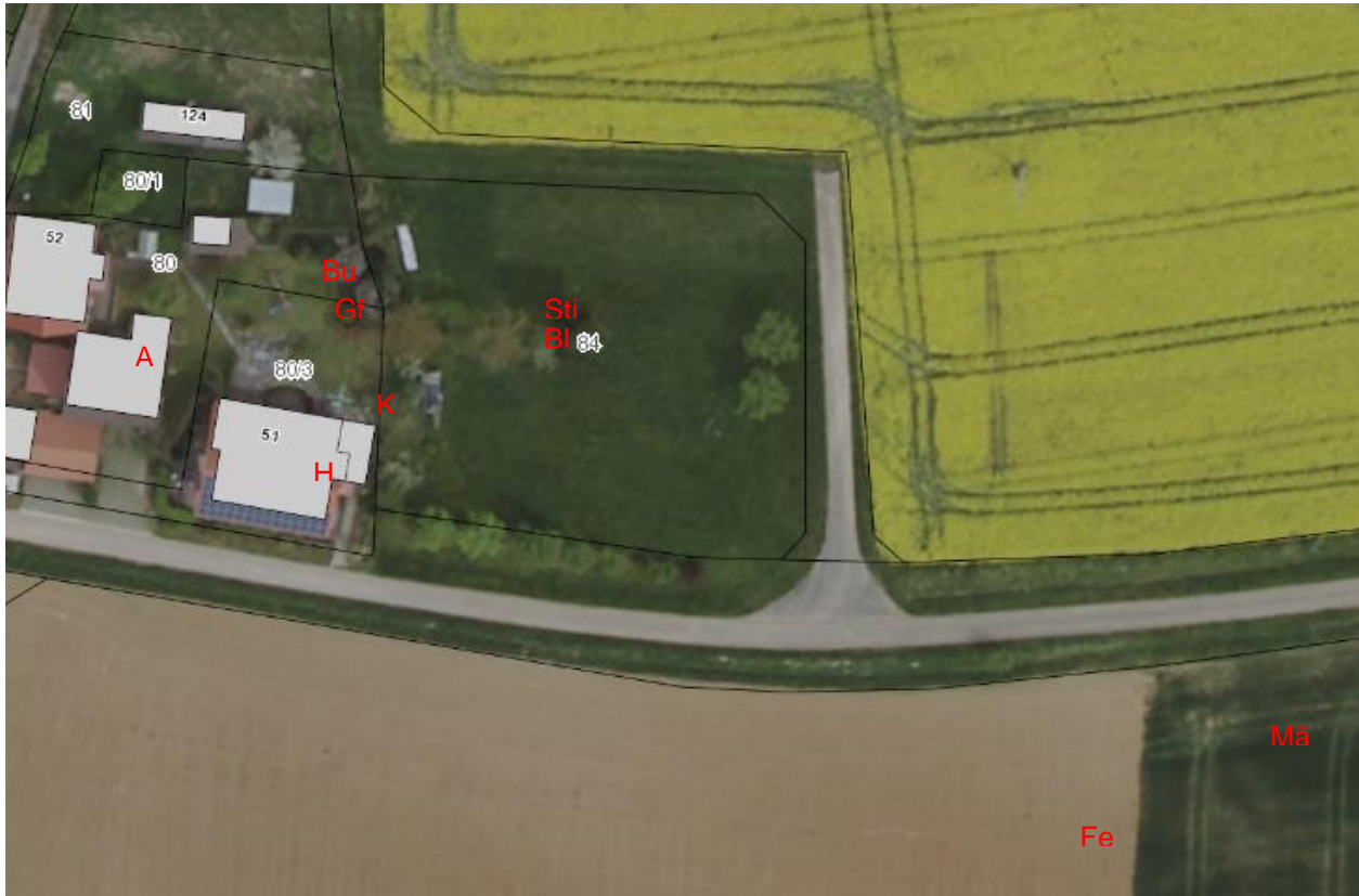
Abb. 5: Ergebnisse der Vogelkartierung. A: Amsel; Bl: Blaumeise; Bu: Buchfink; Gf: Grünfink; Fe: Feldlerche H: Haussperling; K: Kohlmeise; Mä: Mäusebussard; Sti: Stieglitz (Grundlage: Daten aus dem Umweltinformationssystem (UIS) der Landesanstalt für Umwelt, Messungen und Naturschutz Baden-Württemberg (LUBW))

Insgesamt wurden 9 Vogelarten kartiert: Amsel, Blaumeise, Buchfink, Grünfink, Feldlerche, Haussperling, Kohlmeise, Mäusebussard und Stieglitz (vgl. Abb. 5).