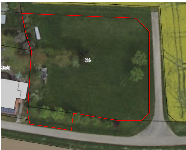
Abb. 1a: Lage des Plangebietes (rot umrandet). (Grundlage: Daten aus dem Umweltinformationssystem (UIS) der Landesanstalt für Umwelt, Messungen und Naturschutz Baden-Württemberg (LUBW))

Das Plangebiet (ca. 1.850 m 2 ) befindet sich auf einem leichten Süd-Hang am östlichen Rande der Ortschaft Wildentierbach. Umgeben wird die Fläche von einem landwirtschaftlich genutzten Acker sowie der im Westen bereits vorhandenen Wohnbebauung.